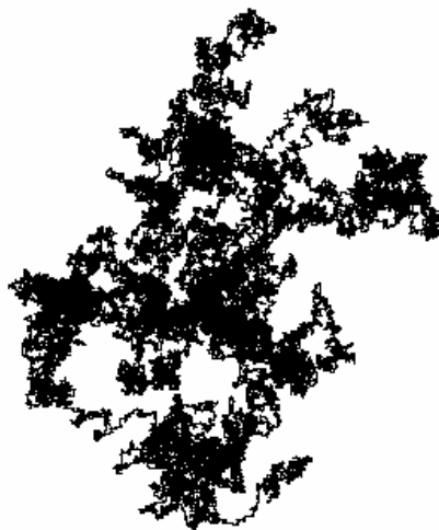
Abbildung 1: Zitterfahrt mit 100'000 Schritten